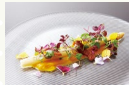
RISTORANTE L'IMBUTO (吹田市)