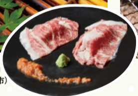
鉄板バル JYU 高槻店 (高槻市)