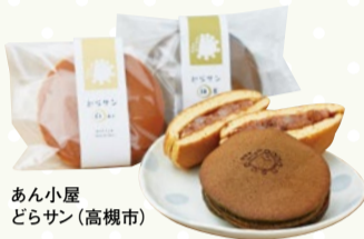
あん小屋 どらサン (高槻市)