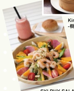
SYLPHY SALADE (箕面市)