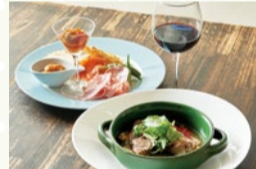
La mia sala Calma (茨木市)