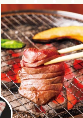
炭火焼肉 慶州館 (豊中市)