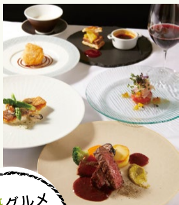
ターブルタカイ (高槻市)