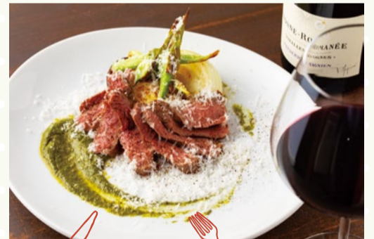
PORTA BLU (豊中市)