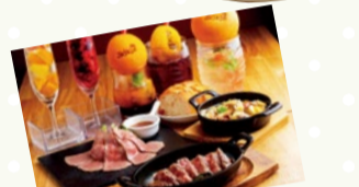
肉バル&ダイナー Jajaja (高槻市)