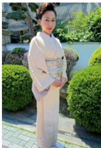
卒入學の際に一番大変な着付。ヘアセットも含めてこの値段はお得。

世界で活躍するスタイリストからも認められたカット技術で、40代以上の女性が頼って通うパフィオ。そんなパフィオがイチ押ししているのが「グランドーマG-upリベリア」。同メニューはカラーで傷んだ髪や、全体的に傷んでしまったクセ毛に効果てきめんの縮毛矯正だ。カラーと一緒に受けても髪のツヤ、しっとりさはトリートメントしたかのような手触りに。髪質に悩んでいるなら受けてみる価値あり。