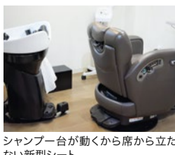
シャンプー台が動くから席から立たない新型シート

が取れるフェザータッチのシェービングは血行促進と美白効果があり、翌日の化粧乗りが変わる。髪を切りにいくだけではなく、美容の要素もありまさに二石二鳥。眠りを誘う。