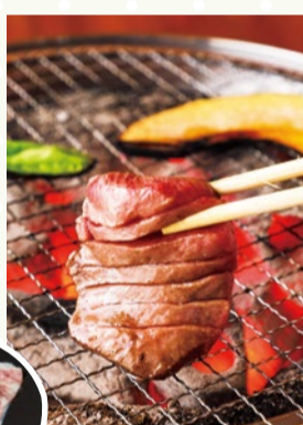
炭火焼肉 慶州館 (豊中市)