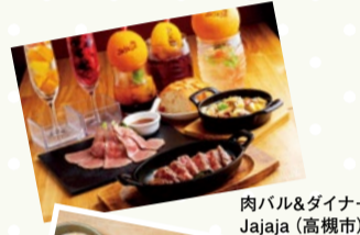
肉バル&ダイナー Jajaja (高槻市)