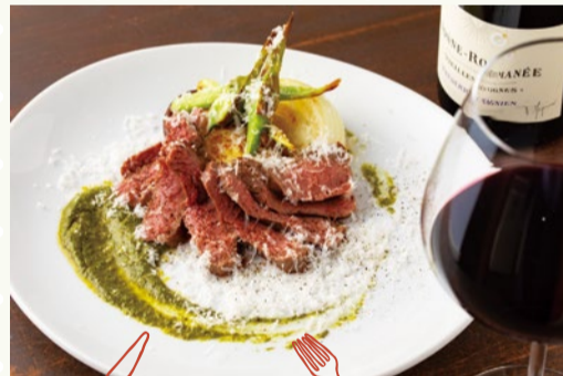
PORTA BLU (豊中市)