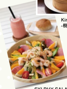
SYLPHY SALADE (箕面市)