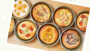
PIZZA PORT KAWANISHI (川西市)