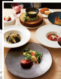
Trattoria TESORINO rosso (箕面市)