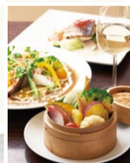
Kino's Kitchen. -樹- (箕面市)