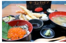
(上)銀蔵 特製北海井 (1,980円)。 (左)銀蔵イクラちゃんセット(1,780円)。

令和最後の年末は「豪華に、ふんだんに、てんこ盛りで」がテーマ!令和元年年末にふさわしい10種類以上のネタを使用した「銀蔵 特製北海井」で来年にトライ!また+800円でさらに大口追加で豪華北海重にバージョンUPも出来る。