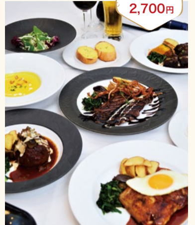
自家製ビーフシチュー 2,700円

香味野菜や赤ワインなどで丸2日間かけてじっくりと煮込む、同店の看板料理！一つひとつのお肉はゴロっと大きく、ホロホロと溶けていくほど柔らかい仕上がりに。身も心も温まる、自信の逸品。