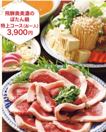
飛騨奥美濃のぼたん鍋 特上コース(お一人) 3,900円

和食一筋のご主人が腕をふるった絶品の数々が味わえる、創業40年以上の老舗割烹料理店。毎年心待ちにしている人も多い、この時期にしか食べられない三楽のぼたん鍋。猪肉三大名産地の一つ、飛騨奥美濃の天然猪肉を使用した、味噌仕立てのこだわり出汁が絶妙と評判！低脂肪・低カロリーで高タンパク質なので、女性にピッタリ。