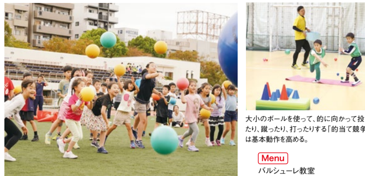
バルシューレはあくまで遊びなので、野球のような投げ方の指導はしない。子どもたちが実際色々な動きを行う中で、自分で考え、経験し、身につけていくそう。

また、バルシューレを楽しむことで、非認知能力の向上が期待できる。非認知能力とは、目標に向かってがんばる力や感情をコントロールする力など、IQなどでは測れない潜在的な能力のこと。バルシューレを通じていろんな動きを経験する中で、自発的に考えることを覚え、自然とやる気・ねばり強さ・探究心などを身につけることができるという。まずは、12月に行われる各会場の体験会に参加して、その魅力、楽しさに触れてみよう!