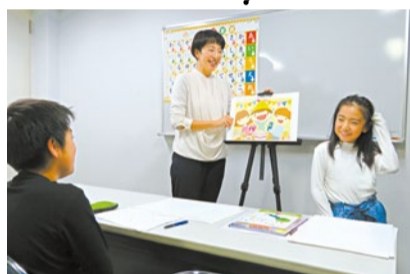
5人までの少人数制なので、一人ひとり丁寧にアドバイス。幼児クラスと小学1~3年生クラスは保護者同伴(5組まで)。