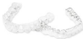
透明なプラスチックでできている「インビザライン」。来院間隔を長く設定できるため、忙しい中高生にはメリットが多い装置と言えます。

開催日: 12月・1月の土曜日(第1土曜を除く) 時間: 11時~16時半のうち約1時間 参加: 無料 ※要予約 問合せ: ホームページの初診予約、または電話