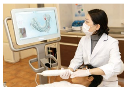
口腔内の状態を`見える化`して説明。治療後の歯列をシミュレーションできるのでモチベーションアップにも繋がります。

・元アナウンサーの先生なのでアドバイスが的確です。「母音クイズ」や「ニュースキャスター体験」を取り入れたレッスンで、子どもは毎回楽しみにしています。(小学校5年生男子・保護者)