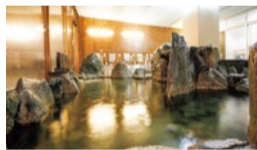
身も心も癒される露天風呂「潮崎の湯」

風光明媚な福良湾と山の景色を全室オーシャンビューで楽しめる「淡路島海上ホテル」。今冬は、「福良産三年とらふぐ」を存分に味わえる特別企画が実施されている。鳴門海峡近くの自然に近い環境でじっくり育てられた、身が引き締まりうま味も濃厚な三年とらふぐ。てっさやてっちり、ふぐ雑炊など豪華な内容をまとめて愉しめ、日帰り昼食プラン・宿泊プランどちらも読者限定、特別価格に。食後は、美肌効果で知られるナトリウム炭酸水素塩泉を満ちた露天風呂に癒されよう。