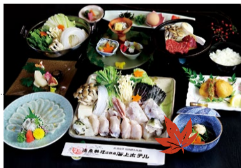
(上) 季節のふぐと淡路島の幸を使った王華会席 (左) 全室オーシャンビュー。落ち着いた雰囲気のある和室でお食事を!