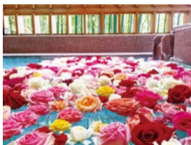
「バラ風呂」毎週水曜日はレディースDayとしてバラ風呂を開催。12時～22時半。「大浴場ゆらり」にて