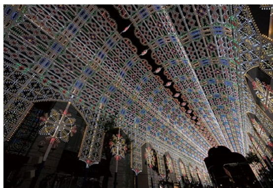
昨年は過去最高となる51万個のLEDが神戸の夜空を彩った。