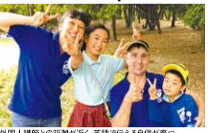
外国人講師との距離が近く、英語で伝える自信が育つ。

安心して遊び・学べる“第二のおうち”として多彩なプログラムを用意した学童(千里中央校)が2020年4月に開講!資格が取得できる習字・そろばん、レベル別英会話、英検®対策、ロボットプログラミング、アートなどを通して、やる気や探求心などの21世紀型スキルと言われる「非認知能力」が育まれる。ディスカッションやグループワークもあり、世界で活かせる本物のコミュニケーション能力を伸ばしてくれる。宿題サポート、休養室完備、バス送迎もあり。12/25(水)～27(金)までウィンタースクールを開催するので、詳しくはHPへ。