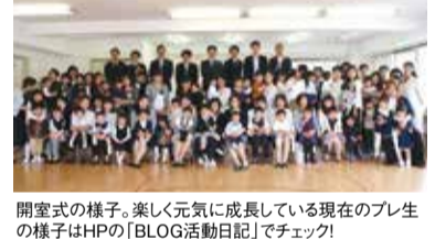
開室式の様子。楽しく元気に成長している現在のプレ生の様子はHPの「BLOG活動日記」でチェック!

講師からのメッセージ 私たちは、親子の絆を守りながら、一人ひとりを大切に、一人ひとりに寄り添いながら優しい子どもへと導きます。子育て中のいろいろな心配事もお相談ください。どうぞ、カウピリキッズスクールを頼りにしてください。