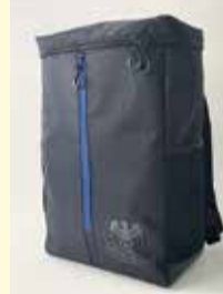
ゴールド会員限定特典 オリジナルリュック