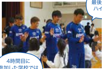
最後は全員とハイタッチ!