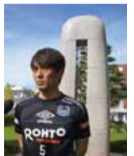
活動後、「祈りと誓いの塔」に祈りを捧げた。