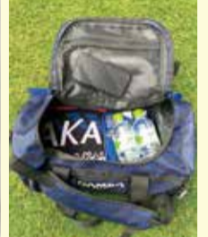
ジュニア会員限定特典 3WAYリュック