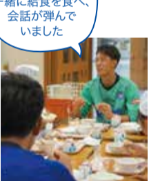
4時間目に参加した学校では一緒に給食を食べ、会話が弾んでいました