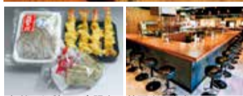
[年越しそば]300食限定 箕面店の店内

毎年人気の「山の冬定食1,100円(写真左)」が登場!ふぐ、アンコウ2尾、海老、レンコン、なす、ごま餅が楽しめる。「そば」も人気で、ご飯とみそ汁の代わりに大そばにするか、定食に小そばを付けることができる。いずれも+100円。どちらの店舗でも終日提供されるように。年越しそばの予約も受付中。予約は店頭か電話にて(数量限定、箕面本店のみ)。