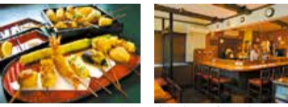
これからの季節はカキの串揚げが人気。さまざまなメニューを愉しんで。家族連れやご夫婦連れまで、落ち着いた空間でとっておきの串揚げを。