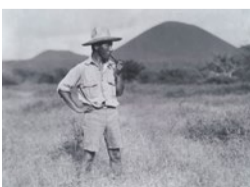
ガラパゴスでパイプをふかす朝枝利男

アメリカの学芸員で写真家の朝枝利男が1930年代に撮影したガラパゴスの風景や動植物などを、彼の描いた美しい魚の水彩画とともに紹介します。