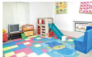
キッズスペースもあるので、お子さん連れもゆっくりに選べて嬉しい。

学習机をお得に賢く購入するなら今がチャンス!本を読んだり、絵を描いたり、整理整頓したり…と学習机は勉強以外の生活習慣を身につける役目があり、子どもの成長に欠かせないものだ。同店には、2020年度の有名メーカーの新型モデルが続々入荷中。驚くほどお値打ち価格で新旧合わせて100台以上からじっくり選べ、イス・デスクマット・カーペットまで付いてくるので嬉しい(椅子変更は差額で可)。丁寧な自社配送で安心して任せられる。長く使えるお気に入りを見つけよう!