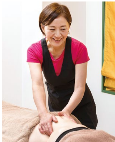
揉んで、絞って、脂肪を燃焼！即効性を追求した手技で、ガンコな皮下脂肪、セルライトを撃退し、引き締めながらお腹べたんこ、ウエストほっそり。

来店者の7割以上が40代以上の中高年女性。ダイエット効果は3カ月で平均10kg減を誇るインドエステの元祖でもあるカプール。インド医学理論「アーユルヴェーダ」に基づく強めのオールハンドケ