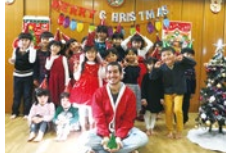
季節ごとのイベントも盛りだくさんで、生徒以外でも参加OK!和気藹々とした楽しい雰囲気、友達もすぐにできる!写真は12月のクリスマスパーティーの様子。

2020年4月から教育改革で大きく変わる英語教育!小学3年生から英語活動が始まり、5年生からは英語が教科になる。スムーズに英語を導入するために、早期の英語学習の開始がおすすめ!同クラブでは、「英語を「聞く」「話す」「読む」「書く」の4技能をバランスよく習得することを目標としている。歌やダンス、フラッシュカードを使ったゲームなどを楽しみながら、ネイティブの発音が自然に吸収できると評判だ。読み書きについても、英語圏の子どもたちがアルファベットを覚える学習法「フォニックス」を取り入れている。「テストで良い点を取ることも重要ですが、様々な国の人が話す英語を聞き、英語で自分の思いを伝えるコミュニケーション能力を身につけることが大切です」と同クラブの講師陣は話す。ネイティブ&日本人講師のWティーチングでサポートしてくれるので、英語に不慣れなママも安心。無料体験は全クラス随時受付中!新しい年のスタートにピッタリの習い事を始めてみよう!