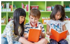
幼稚園以上のクラスはフォニックスを使ったリーディングプログラムを導入している。