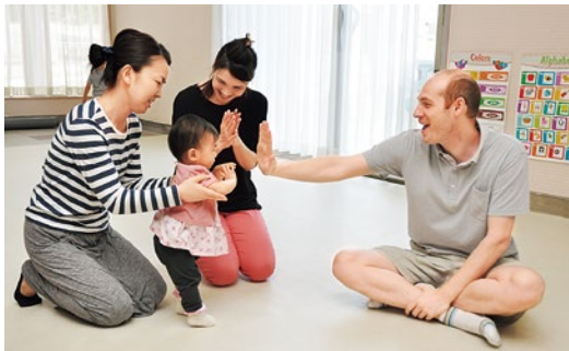
ネイティブの発音に触れながら、わかりやすい指導で丁寧にフォローしてくれる。