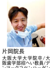
片岡院長 大阪大学大学院卒/大阪歯学部招へい教員/デンマークユニバーゲン大学歯学部留学

虫歯治療での詰め物や被せ物、義歯、インプラントのメンテナンス(上部分)、マウスピース、矯正装置を作成ではデジタル