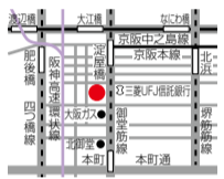
淀屋橋駅13番出口より徒歩1分 本町駅2番出口より徒歩5分

特典 「シティライフを見た」で デンタルエステ専門の 歯科衛生士が施術 ●初回カウンセリング込み オフィスホワイトニング …30,000円→10,000円 (要予約・1月末まで)