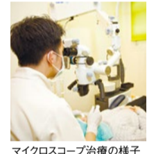
マイクロスコープ治療の様子

特典 「シティライフを見た」で デンタルエステ専門の 歯科衛生士が施術 ●初回カウンセリング込み オフィスホワイトニング …30,000円→10,000円 (要予約・1月末まで)