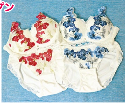
▲脇高ブラ&ショーツ3,850円

「こんなにしっくりくる下着に出会えたのは初めて!」と喜びの声。完全予約制で、カルテを作り貴女にぴったりな下着を丁寧に選んでくる。垂れた胸やお尻、はみ出た背中のお肉にはシェイパーやガードル、脇高ブラがおすすめ。正しい下着を付ければ1カップサイズアップする人がほとんどで、細見え効果も。国内メーカーがかなりリーズナブルに購入できるので、ぜひ訪れてみて。