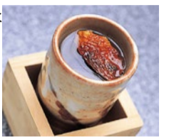
ひれ酒(730円)は 丁寧に焼き上げた ひれを醬汁に使い、 一口ごとに芳醇な 香りが広がる。

熊本県天草で育てられた最高級国産とらふぐ の美味しいところを、余すことなく味わえると人気 の同店。いけすで泳いでいる秋ふぐを注文が入 ってから捌くので、抜群の鮮度と歯ごたえを楽し める。先代から引き継いだ、ふぐだけに合う自家 製ポン酢でいただくてっさ、ふぐ鍋は別格!!お持 ち帰りセットがスタート!てっさ、ふぐ鍋が付いて2 ~3人前で10,000円(税込)と破格。お家でも ふぐを愉しもう。詳しくは 電話で問い合わせを。