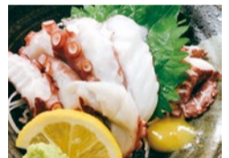
地元大阪湾のたこは 大阪の「プライドフィッ シュ」に指定されている大 阪を代表する海産物!泉 だこ唐揚げ、天ぶら、刺 身、たこづくし等は680 円。泉だこの酢の物は 480円。