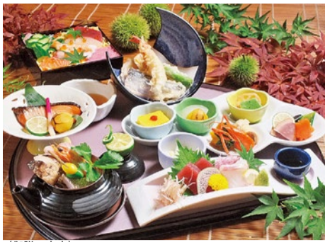
【御膳の内容】 口取りプレート/お造り盛合せ/松茸香る土瓶蒸し/ 季節の天ぶらの盛合せ/旬魚西京焼き/炊き込みご飯/香の物