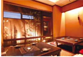
店内は徹底されたコロナ対策がされており、個室で安心してご飯を楽しむことができます。

／特典 「シティライフを見た」と前日までの予約で ●【ランチ限定】松茸の土瓶蒸しと秋の旬菜御膳 …… 3,000円→ 2,500円 【口取りプレート/お造り盛合せ/松茸香る土瓶蒸し/ 季節の天ぶらの盛合せ/旬魚西京焼き/炊き込みご飯/香の物】 +500円で炊き込みご飯→ ちらし寿司に変更可能 ●さらに食後のデザート、コーヒーをサービス! (10月末まで)