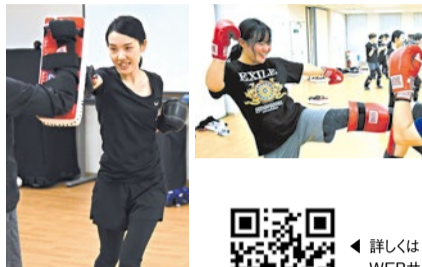
「心身ともにスッキリする」と毎週の楽しみにしている女性会員も多数。