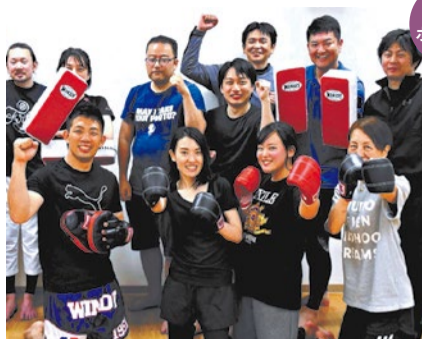
「初心者でも続けられるキックボクシング」がコンセプト!