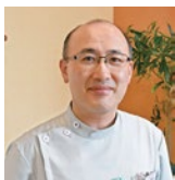
金曜館 院長 大阪大学歯学部を卒業後、 口腔外科学第一教室入局。 2015年に開業。大阪大学博士(歯学)。

親知らずとは、真ん中の歯から数えて8番目にある大臼歯のことです。現代人は顎が小さいのできれいに生えることが少なく、完全に埋まったり、横を向いたり、まっすぐ生えても中途半端に歯肉が被っている、ということが多くあります。そのため、清掃が不十分になり、むし