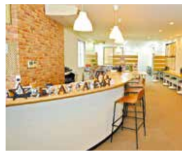
手前がカフェスペースで奥が学習スペース。現在は席を1つ開けて学習するようにしている。

大学受験専門の、高校生を教えることに特化した塾。各大学の入試傾向と参考書の特徴を徹底分析し、例えば「今の成績で国立志望なら、これらの参考書をマスターすれば合格できる」と一人ひとりの受験戦略を明確に組み立てる。学習内容を年間スケジュールから週単位まで落とし込むので、週毎にやるべきことが明確になり、安心して受験勉強に臨むことができる。特に高校2年の受験勉強は今から数学の演習を始めないと万全の体制で臨めなくなるよ。[実は、参考書だけで志望校合格は可能です。大学受験では計画倒れや無駄な努力が多いんです。成績が上がる環境はこちらで整えます。もちろんわからないことがあれば全力でサポートします]と塾長。「授業をしない塾」それでも志望校に合格する理由。相談会で確認を。