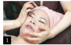
1 老廃物が流れ出し、シワやほうれい線、目のたるみが引きあがった小顔に。