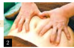
2 30代後半からのお腹や腰回り簡単には取れないセルライトがびっしり、しっかりほぐしていくと1回でもサイズダウンがわかる。