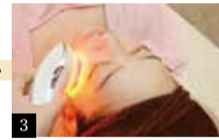
3 高濃度生ビタミンCとコラーゲン注入。さらに筋肉運動を働きかけるEMSで引き上げた肌を長持ちさせる。