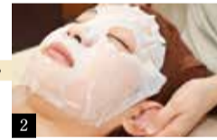
2 耳ツボ刺激で血流が良くなり顔のくすみ撃退。体がポカポカになり、内蔵機能の調整効果もある。