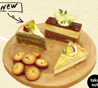
①さつまいものチーズタルト 378円 ②さつまいもとリンゴのムース 432円 ③ほうじ茶とさつまいものミルクレープ 432円 ④さつまいもクッキー(袋入り120g) 378円