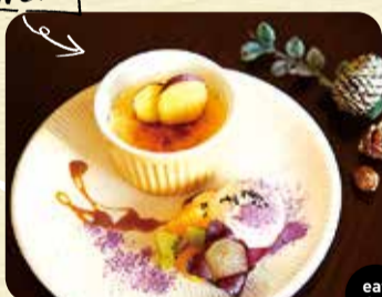
さつまいものクリームブリュレ ※ドリンクセットあり ブリュレ 600円 ドリンクセット 880円