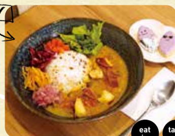
①茨木おいものInfinityカレー 900円 ②茨木おいものアイシングクッキー 1枚300円