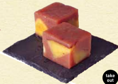
お芋の蒸し羊かん 220円