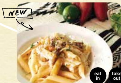
おいものペンネ・クリームソース テイクアウト 1,200円 店内飲食 1,150円