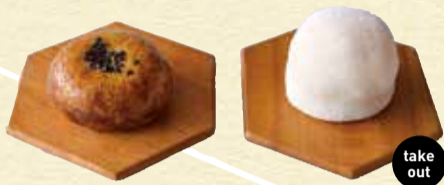
①いもあげちゃん 140円 ②芋チーズ大福 140円