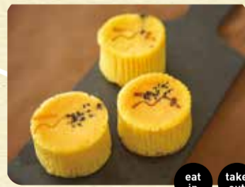
あんマフィン さつまいも テイクアウト 194円 店内飲食 198円