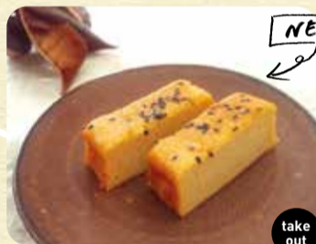
いろはにぼと 180円 (さつまいものケーキ)