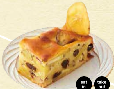
さつまいもとりんごのパウンドケーキ 380円