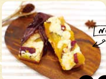
茨木産さつまいも スティックタルト 330円