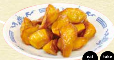
中華ポテト 900円 eat in take out