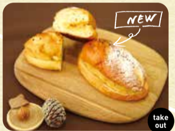
パン・オーレ さつまいもクリーム仕立て 220円 take out