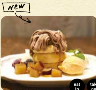
サツマイモとモンブランのパンケーキバフェ テイクアウト 650円 店内飲食 1,000円 eat in take out