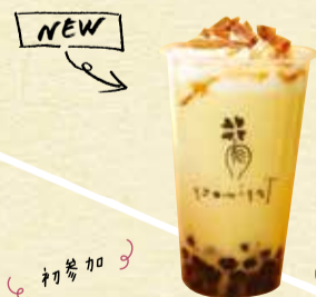
さつまいもスムージー 724円 take out