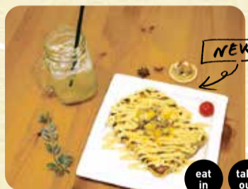
①紅はるかのフレンチトースト 600円 ②紅はるかのドリンク酢 500円 eat in take out