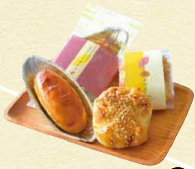
①スイートポテト 150円 take out ②お芋と栗のパイ 180円