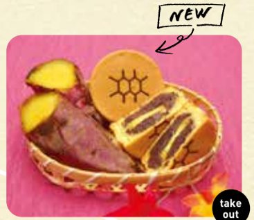
①さつまいもアップル(芋クリームにりんご) 140円 ②ぱっくりいも(あんといも) 140円 take out