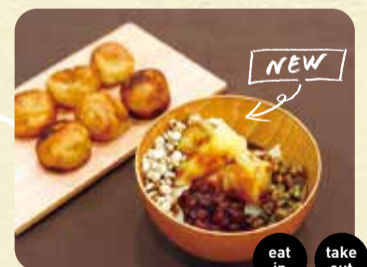
①地瓜球(台湾サツマイモドーナツ) 350円 ②蜜芋豆花 450円 (台湾デザートに蜜煮したサツマイモをトッピング) eat in take out