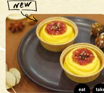
生スイーツポテト テイクアウト 270円 店内飲食 275円 eat in take out