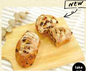
お芋ぎっしりモチモチカレンズパン 230円 take out