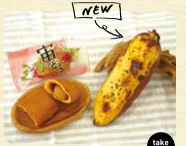
①宙どら 172円 ②窯やあへき芋♪ 測り売り 100g 270円 take out