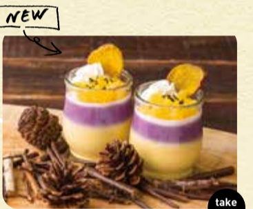
Oimoリッチスイーツ 431円 take out