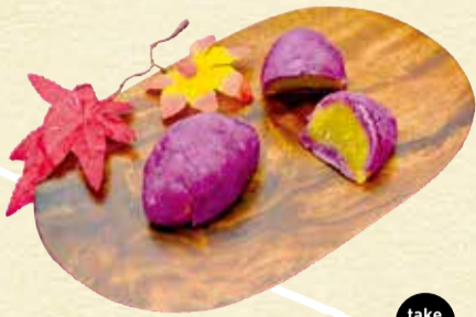
紫いも 160円 take out