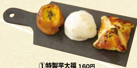
①特製芋大福 160円 ②芋パイ 170円 ③やきいもさん 170円 take out