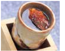
ひれ酒(730円)は丁寧に焼上げたひれを贅沢に使い、一口ごとに芳醇な香りが広がる。

熊本県天草で育てられた最高級国産とらふぐの美味しいところを、余すことなく味わえる同店。注文が入ってから捌いたふぐのコクと歯ごたえは絶品。ふぐの旨味を引き出す自家製ポン酢で食べるてっさは別格! 豚の雑炊はふぐの野菜の旨味たっぷり何杯でも食べたくなる。お持ち帰りセットはてっさ、ふぐ鍋が付いて2~3人前10,000円(税込)と破格。寒くなったらお店・お家でふぐを愉しもう。詳しくは電話で問い合わせを。