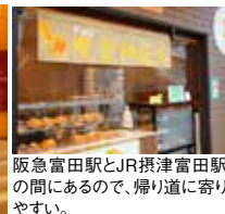
阪急富田駅とJR摂津富田駅の間にありますので、帰り道に寄りやすい。