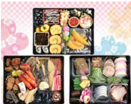
特選おせち三段。彩りが良くこだわりの食材を使ったモリタ屋で人気NO.1のおせち。