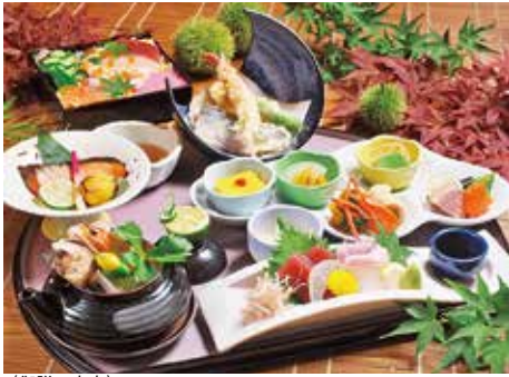
〈御膳の内容〉 口取りプレート/お造り盛合せ/松茸香る土瓶蒸し/ 季節の天ぶらの盛合せ/旬魚西京焼き/炊き込みご飯/香の物