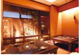
店内は徹底されたコロナ対策がされており、個室で安心してご飯を楽しむことができます。