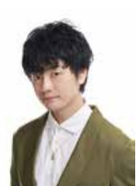
(左)アニメでは若い夫婦が高槻の魅力を伝える (右)200タイトルを超えるアニメに出演する実力派声優の福山潤さん