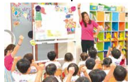
園内は活気に溢れ、いつも子ども達の笑い声が響いている。

“知育・徳育・体育の三育法を基にバランスの取れた人材育成”を理念に、10周年を迎えた服部緑地園と、昨年4月開園の江坂園。異年齢保育を実施しており、思いやりの気持ちや社会適応能力の基礎が身につく。音楽・英語・体育・制作・書道などの多様なカリキュラムで子どもの可能性を引き上げる、たくさんのことを学べる環境だ。11月28日(土)に令和3年度生