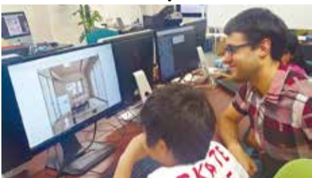
講師は、インターナショナルスクールの教員経験がある外国人などが担当する。

北摂エリアで一早くプログラミング教室を開校したキノコードでは、プログラミングと英語と一緒に学べる「英語コース」を開設中! プログラミングで使用するコードがすべて英語であることから、自然と英語が身につくのが特徴。Scratchに加えてPythonも学べるベーシッククラスに加え、Unityで本格ゲームプログラミングが学べるアドバンスドクラスも! また、英語コースは新たに土曜日が開校日となり「サタデースクール」体験も可能に!