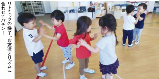
リトミックの様子。お友達とリズムに合わせてハチン!