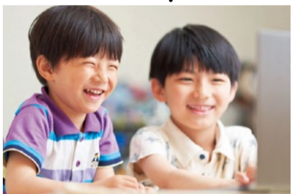
楽しみながら思考力を鍛える時間。ロボット知識をつけるだけでなく、社会を見つめる、科学する心を養うことを大切に。