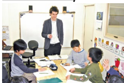
(上)帰国子女やプリスクール卒園生が中心で、授業風景は海外のよう。