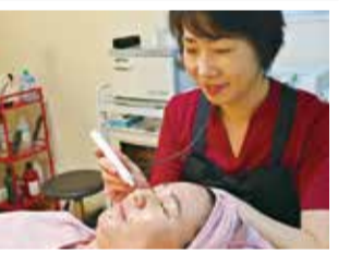
シミのメラニンピンポイントで凝固させ、1週間前後でアカとなって自然にはがれ落ちる。エステとの相乗効果で美白&ツヤ肌に。繰り返すごとにシミが薄くなり、効果を実感!