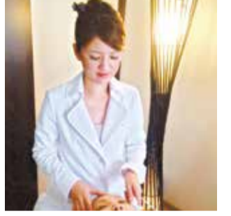
表情筋と神経の動きを促す独自のメソッドで、目の下に溜まった脂肪を撃退。コラーゲン・ヒアルロン酸を深層にまで届け、しわ・しみ・たるみをしっかりケア。同店一番人気のメニュー。