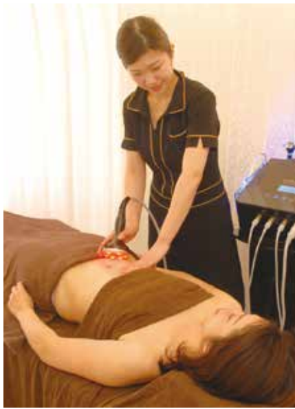
エステティシャン歴5年以上のベテランスタッフが揃っている。