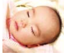
数多くの妊娠実績あり。喜びの声など、詳しくはHPで。

北摂でも数少ない、煎じ薬・粉薬の調合も行う漢方専門薬局。子宝相談は得意分野で不妊漢方治療のエキスパート。多嚢胞や高FSHなど幅広い原因に対応可能で、妊娠した4人に1人が40代という。クリニックから卵の質改善で同店を紹介され、ここに来て自然妊娠された方も。細かく時期や体調を見ながら、「今」必要な漢方で体を整えていく。男性不妊の実績も多数で自然妊娠希望の方にも心強い。