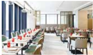
豊富な席数。グループでの利用もOK。

世界有数のホテルブランドを展開するマリオット・インターナショナル。昨年10月にオープンした「コートヤード・バイ・マリオット大阪本町」では、ラグジュアリーな空間で食事を楽しむことができるレストラン「STITCH」が人気! オススメは、肉料理などをオーダービュッフェで存分に楽しむ「Meats Meet at STITCH」!注文を受けてから特製の鉄板で焼き上げる淡路島産牛やブランドポークは絶品!記念日や女子会など様々なシーンで活用してほしい。