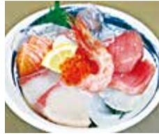
日替わりで8種類以上の海鮮が乗るボリューム満点の「ぎょぎょぎょの海鮮丼」が読者限定でおトクに楽しめるランチ限定で