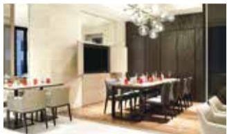
半個室やソファ席なども用意。