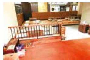
(中)全席ゆったりとした店内で、心ゆくまで食事やお茶を楽しんで。(下)座敷とキッズスペースもあるので小さなお子さん連れでもゆったりできると評判。