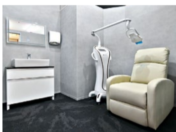
10分で2トーンほど歯が白くなるといわれる最新の3Dホワイトニングマシンや、本格エステ店で扱われるキャビテーションなどプロ仕様のマシンが揃う。