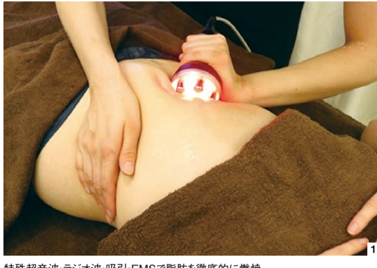
特殊超音波・ラジオ波・吸引・EMSで脂肪を徹底的に燃焼。