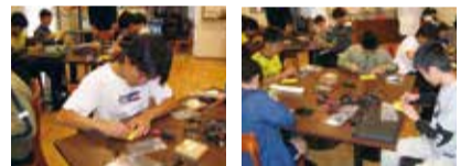
液晶画面の設置やスイッチの配線から子どもたちの手で行うゲーム機作り体験。単純そうに見えるゲームも、作る側にまわってみると注意すべきことがたくさん!

STEGS (Science & Technology Education Group for Students) ソラド(株)・SRS・(株)理数学院・童心舎・(株)すまいる学習塾 https://stegs2019.wixsite.com/stegs-home