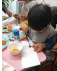
左) 音読の様子 右) 野菜を使った理科の実験

幼児、小学生と学年、年齢ごとに細かく学ぶ内容が分けられており、幼児期には主に知性領域指導と呼ばれる言語・感情・空間認識・運動などの能力を養うことや、機能領域指導と呼ばれる落ち着き、注意力、好奇心、数量認知などの能力を養っていく。