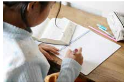
～2020年度より、正式に小学校5・6年生で英語の授業がスタート～

価(成績)については、学習指導要領に示されている内容、目標に準じて、各校が年間指導計画の作成や評価の在り方について検討することに。また、教員の指導力向上のために研修や勉強会、研究会なども積極的に行われている。そしてこれまで5年生から必修だった外国語活動が小学3・4年生で必修になり、課程外ではあるが低学年でも英語にふれる時間が設けられている。幼少期は音声も柔軟に受け止めるのに適しているため、家庭でも英語にふれる機会を作ってあげること、将来の英語学習への素地を育てておくのもおすすめだ。