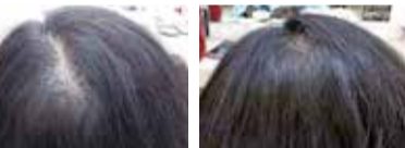
(左)ビフォー、(右)アフター。こちらのゲストはコースを始めて6か月後にはつむじが隠れるほどに。※個人差あり。