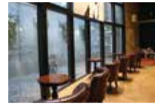
大きな窓がスタイリッシュな待合席。落ち着いてカウンセリングを受けることができる。