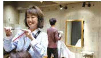
40代以上の経験豊富な女性スタイリストが多く在籍。

セット台は全部で10台。席と席の間の距離が空いているので、ゆったりと施術を受けることができる。