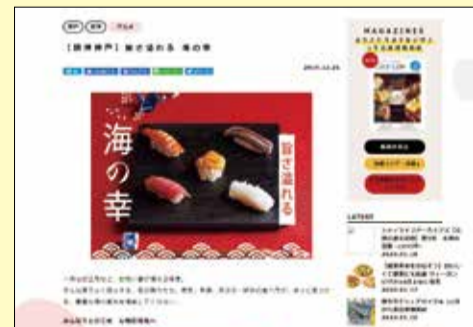
旨さ溢れる海の幸