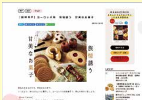
ヨーロッパ発 旅情誘う甘なお菓子