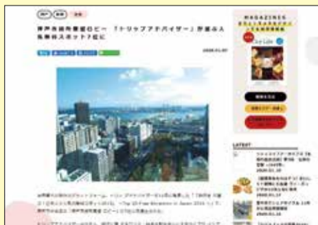
神戸市役所展望ロビー「トリップアドバイザー」が選ぶ人気無料スポット7位に