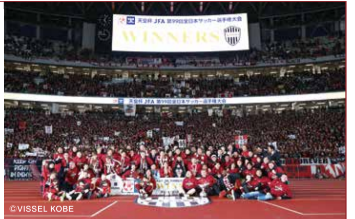
試合終了後、サポーターと喜びを分かち合う選手たち。キャプテンのイニエスタ選手は「こういったい形で最後を終えられることを本当に喜んでますし、チームにとっても自分にとってもみんなにとっても素晴らしい一日です」とコメント。