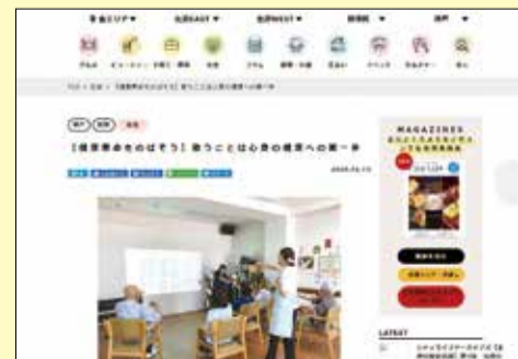
【健康寿命をのばそう】歌うことは心身の健康への第一歩