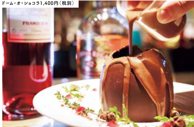
ドーム・オ・ショコラ1,400円(税別)