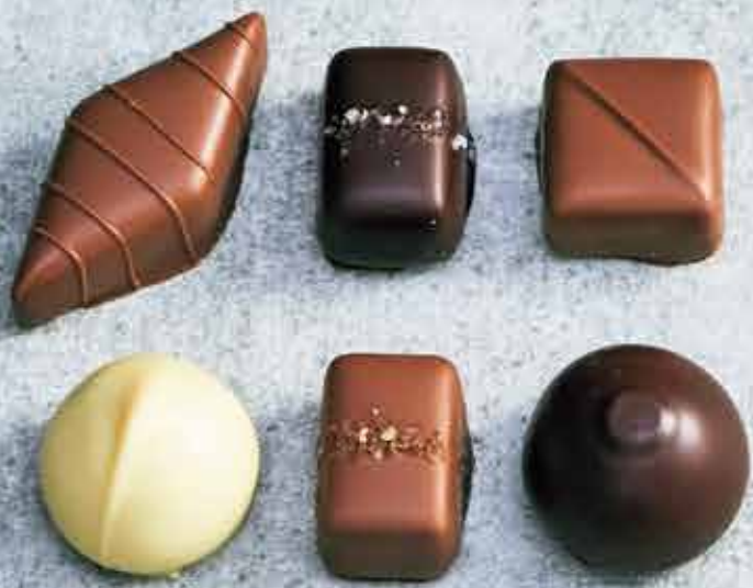
〈左右〉トリュフシリーズ400円/個(税別) 〈中〉グレイソルトキャラメル、スモークソルトキャラメル350円/個(税別)