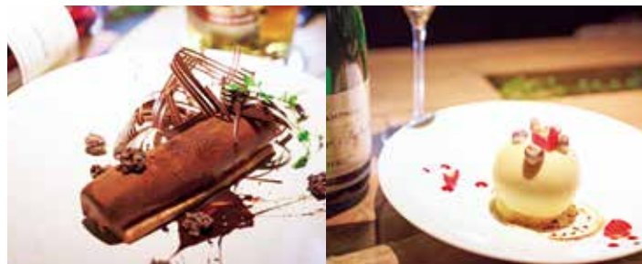
神戸の老舗製菓店「レーブドゥシェフ」とのコラボスイーツも人気を博している。