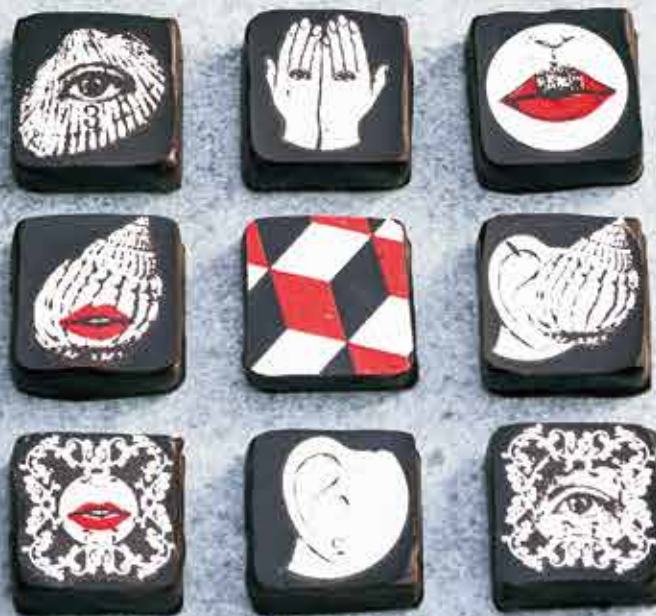
cha-the chocola (9粒入り)4,500円(税別)