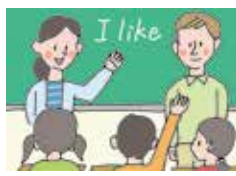
取材協力/豊中市教育委員会 学校教育課

豊中市では外国人英語指導助手派遣を拡充し、生きた英語学習の環境づくりを進めている。英語教育コアスクール(英語教育研究校)においては、中学校英語科教員の小学校への乗り入れ授業の実施や評価の研究実践を進めるとともに、その成果を広く発信し、市内小・中学校の英語教育の一層の充実をめざしている。小学3・4年生の「外国語活動」の授業は、言語活動を中心とし、英語に慣れ親しみ、言語や文化等についての理解を深めている。小学3年生からALT(外国人英語指導助手)とのチームティーチングを実施しており、英語でのコミュニケーションに慣れ親しむ機会が充実するよう実施している。