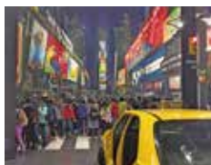
取材協力/吹田市教育委員会 指導室

吹田市では、教育課程特例校として小学校1年生から外国語活動を実施しており、専科指導教員や英語指導助手の配置及びデジタル教材等の活用により効果的に学習を進めている。また小学校4年生対象の「すいたえいごkids」ではAETとビンゴやクッキング等を英語だけで行う体験活動を実施している。さらに小学校6年生対象の「すいたえいごweek」ではEXPOCITYにあるOSAKA ENGLISH VILLAGEで、小学校で学んだ英語を活かしてレストランや航空機内等のシチュエーションの中で、実際にネイティブスピーカーとのやり取りを行う実践の場としている。小中一貫した英語教育により「世界的視野を持ち社会貢献できる真のグローバル人材の育成」を目指している。