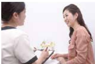
ひとり一人にあった効果のあるメニューを相談しながら作っていく。

全国ダイエットコンテスト1位の同店が生み出した「痩身モンスター」。同メニューは下腹部とお尻についてしつこい脂肪を3つの施術で同時に刺激し、最後にオールハンドの「水分回収」を行う。自分で痩せられない人、短期間で痩せたい人にピッタリ。春に向けてリバウンドのないダイエットで若返ろう。