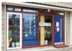
JR高槻駅西口からすぐのところであり、買い物ついでに治療もできる。

腰痛専門施術 筋肉整体 紅葉堂 (モミジドウ) 高槻市上田辺町7-17 東ア第2ビル1階 営/9時~20時 月曜定休 ☎050-7131-3306