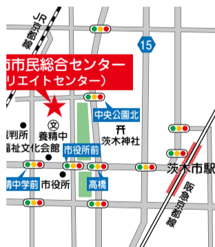
(料)はありますが、台数に限りがございます。公共交通機関をご利用ください。