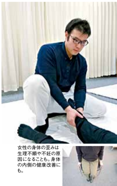
女性の身体の歪みは生理不順や不妊の原因になることも。身体の内側の健康改善にも。

痛み止めやブロック注射、骨盤矯正などいろんな治療を試したが改善出来なかった人たちが「改善された」と実感するテアシスプログラムを取り入れている健楽院。同治療法は科学的に証明できる検査法で身体の歪みを見つけ、痛みにならない範囲で施術を行い歪み・痛みを改善していく。腰痛やひざ痛は骨ではなく、筋肉のバランスが悪くなり、身体を歪ませていることが痛みの原因。世界中で多くの著名人が身体の調子を整えるために頼っている「テアシスプログラム」。痛みの根本改善に一度体感してみてください。