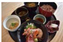
この日の「日替わり御膳」(800円)は「お造り盛りあわせ」。プラス200円で京都の老舗「小川珈琲」のコーヒーも。

やまかげ)は「包丁の祖」として知られ、毎年4月には名店で修業を積んだ料理人が参加する「包丁式」も行われるなど料理に縁が深い。ポタラの厨房を担当するのは包丁式の料理人とあって、見た目も味も一級品。人気のランチは日替わり御膳や松花堂弁当など和食を提供している。モダンな造りの店内から全面ガラス張りの向こう側には境内が広がり、厳かなたたずまいの本堂を前に自然と心も静まりそうだ。友人とランチに来たという70代の主婦は「料理もおいしいし景観もきれいなので、よく利用しています」と話していた。