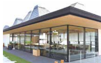
屋根は補陀洛山の切り立った高い山をイメージ。

やまかげ)は「包丁の祖」として知られ、毎年4月には名店で修業を積んだ料理人が参加する「包丁式」も行われるなど料理に縁が深い。ポタラの厨房を担当するのは包丁式の料理人とあって、見た目も味も一級品。人気のランチは日替わり御膳や松花堂弁当など和食を提供している。モダンな造りの店内から全面ガラス張りの向こう側には境内が広がり、厳かなたたずまいの本堂を前に自然と心も静まりそうだ。友人とランチに来たという70代の主婦は「料理もおいしいし景観もきれいなので、よく利用しています」と話していた。