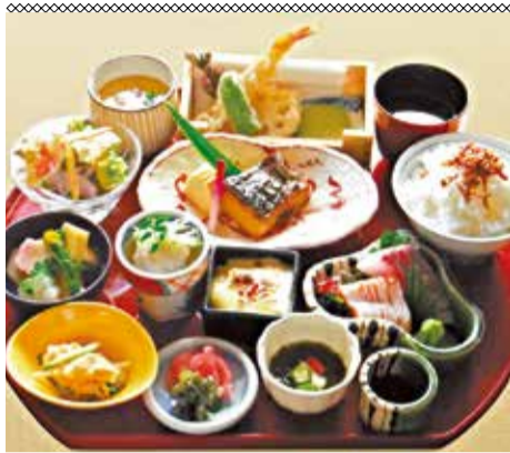
おぼんざい お魚十菜膳(旬魚の造り/季節の焼き魚/魚介の揚げ物/旬の小鉢/酢の物/サラダ/和え物/蒸し物/煮物/ご飯/香の物/汁物/甘い)。