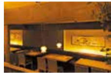
京町屋風の落ち着いた店内は座敷や掘りごたつなど全68席。個室もあるので女子会にピッタリ!

市場から直接仕入れる新鮮な魚介類を贅沢に盛り込んだランチ「おぼんざい お魚十菜膳」がオススメ。旬の魚を造り&焼き&揚げ物で味わう。他にも、煮物や蒸し物など、たくさんの料理を少しずつ楽しめるので女性人気が高い。西宮北口駅をおりてすぐなのでアクセスも良い。おトクな読者特典で自慢のランチを楽しんで!