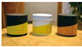
各地の茶所で採れた茶葉を自宅でも楽しめるよう、缶入りでも販売(左)さやまかおり、(中)あさつゆ、(右)ごころ 各1,300円(税別)