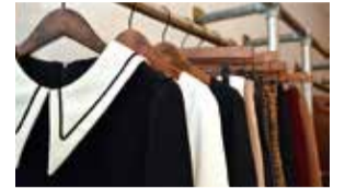
落ち着いた大人の雰囲気漂うオリジナルブランドのカットソーは3,000円(税別)~手に入る。