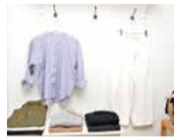
さわやかな色合いの「肩下がリノカラーブラウス」11,000円(税別)と、「テーパードワイドストレートパンツ」12,000円(税別)は春へ向けてのオススメ。