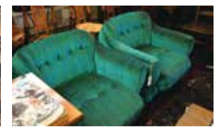
落ち着いた色合いとフカフカの座り心地が、身も心も癒してくれる。ソファ12,000円(税別)