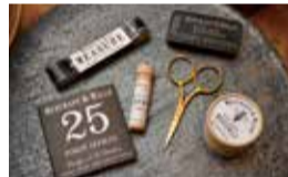
クールな見た目と機能美が光るマーチャント&ミルズの裁縫道具は日本で一番のシェアを誇る。