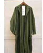
バイクルーズのデニムを主力とするリメイクブランド「BONUMボナム」のウェアは、サイズにこだわらない点々。5,470円(税別)