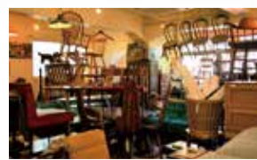
開店当初は30点ほどだったが、現在店内には約90点の家具がズラリと並び。