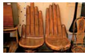
独特な形が一際目を引くマホガニー材の椅子12,000円(税別)は、メキシコのウッドクラフト職人の技が光る。