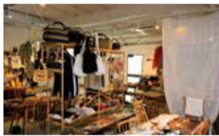
2018年9月に現在の場所へ移転。オーナーが、ジャンルを問わず時代に合うようにとの想いで選んだグッズが豊富に揃う。

●神戸市中央区栄町通2-2-14 日栄ビル南館 営/11時~19時半 ※水曜のみ16時半閉店 不定休 TEL 078-334-7225 http://www.vivova.jp Instagram@vivo_va