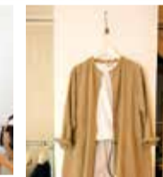
落ち着いた大人の飾らない雰囲気惹かれるコーディネート。ロングフレアワンピース14,000円(税別)、ドルマンカットソー4,900円(税別)、ワイドテーパードパンツ12,000円(税別)