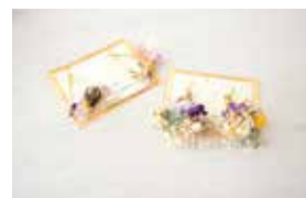
本物の花を使用しているのは、手作りだからこそ。ピアス2,800円(税別)