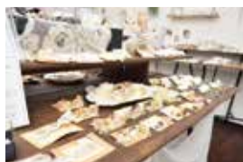
全国から約20名の作家(うち10名程は月替わり)のハンドメイドアクセサリが集まる。有名作家の作品も多数。