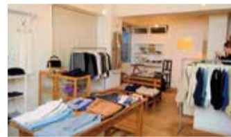
店内にあるほとんどの衣服がオリジナル。肌触り、形、動きやすさなど細部にわたるこだわりで魅了されて、多くのリピーターが訪れる。