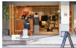
今年1月にグランドオープン。店内にはお茶以外にも、地産の新鮮野菜やオリジナルアパレルグッズも揃う。

●神戸市中央区栄町通1-1-9 営/10時~20時 無休 禁煙 https://chanomistand.com Instagram@chanomi_stand