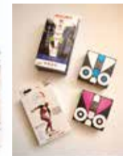
日々の健康を願う人へ向けた、イタリアのメーカカルスボ「ツウエア」ACCAPPI(アカピ)の商品を関西で唯一取り扱っている。