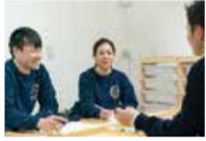
スタッフ同士でも連携し、子どもを見守る体制もしっかり整えている。

脳科学に基づく独自の療育カリキュラムを提供する児童発達支援教室。先日豊中に新規開校したばかりの同教室は、春の入学見学会を各校で実施中。カリキュラムの特徴は、お箸の正しい持ち方を身につけながら脳に刺激を与える「指先強化トレーニング」や、社会性を高める「ワーキングメモリートレーニング」など40種類以上のトレーニングを個別に構成し苦手分野をケア。さらに、保護者には毎月のレポートや、個別の面談・相談の場を提供するなど、保護者や通っている園との連携を重視しているところも心強い限り。無料見学会は各校で随時実施中。