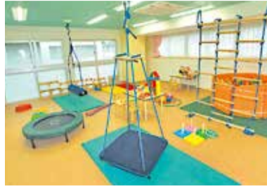
※SEDスクール箕面の様子 (上)感覚調整遊具はバランス感覚を養うブランコなど多数取り揃えている。 (左)保護者はマジックミラー越しに、子どもの様子を見ることが出来る。