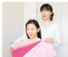
春夏秋冬のタイプによって、似合うピンクもそれぞれ違う。