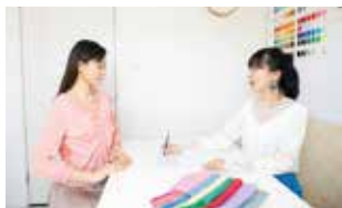
基本2~3名までの少人数制の合同診断となる。客観的に見ることでより理解が深まるという。

カラー&イメージコンサルティング Atteindre (アツンドル) 吹田市江坂町1-14-8 (地下鉄御堂筋線江坂駅より徒歩5分) 料金は事前振込制。予約の空き状況確認とお申し込みは右記のQRから。 WEBサイトでは豊富な変身事例も掲載。 https://www.atteindre700.com/