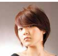
憧れのヘアスタイルが叶うと驚き、紹介も多い。

「髪型を褒められるようになった」とお客様に喜んでもらっています。諦めずになりたい髪型を叶えましょう。