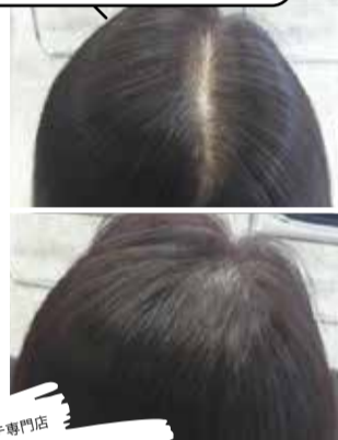
増毛エクステ専門店 プラスフォー 写真は400本増毛。