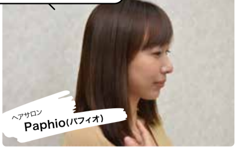
ヘアサロン Paphio(パフィオ)