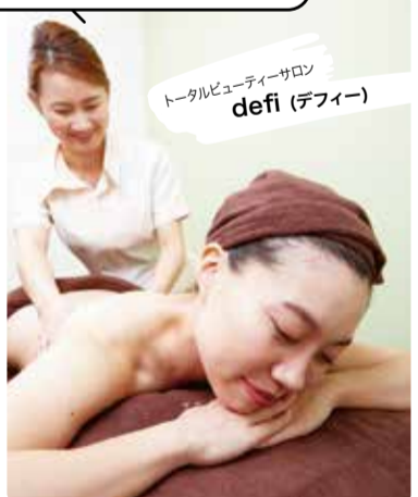
トータルビューティサロン defi(デフィー)