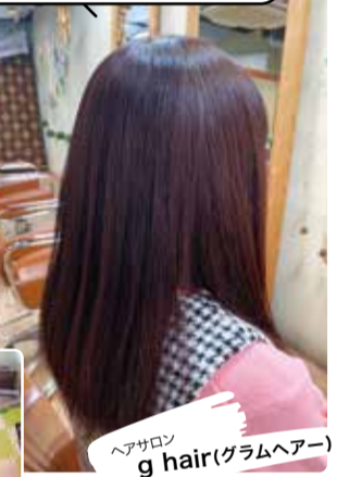
ヘアサロン g hair(グラムヘア)