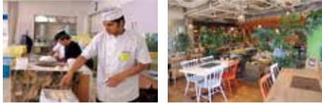
↑毎年好評、インド人シェフによる特製本格カレーと焼きたてナンが一度に味わえるここだけのお楽しみイベントも5月以降に開催予定!

日替わりの洋風創作ランチのほか、ボリューム・内容ともに充実したコースが人気の立命館大学OIC内にあるダイニングレストラン。肉料理からオードブル、特製ピッツァなど上質食材を使ったメニューが自慢で、ソファ席やテラス席も設置。遊び心満載の開放的な店内は緑に囲まれ、アクセスも抜群!好評の貸切プランは20名~120名まで幅広く対応可能なうえ、プロジェクトや会場使用料が無料なのも嬉しい。早めの予約がおすすめ!