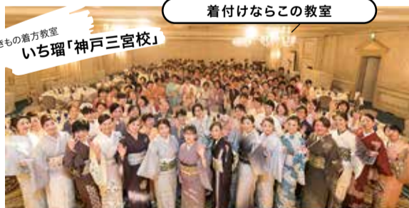
きもの着方教室 いち瑠「神戸三宮校」

全国で47教室を展開中の「いち瑠」は東証一部上場「一蔵」がプロデュースする着方教室。礼法なども学ぶ充実のカリキュラムが人気。日本和装協会認定資格の取得も可能。