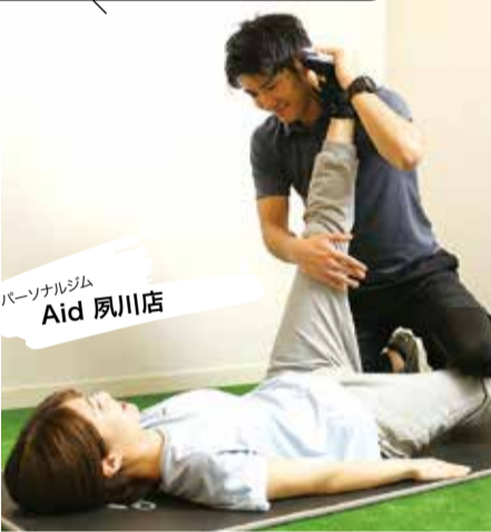
パーソナルジム Aid 夙川店