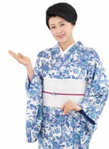
いち瑠のイメージモデル藤原紀香さん

ウェアやシューズをはじめ、プロテイン、サプリメント、バスタオル等の各種アメニティ、シャワー&パウダールームも全て無料完備。キッズルームもあるため子どもと同じ空間でトレーニングに励める。