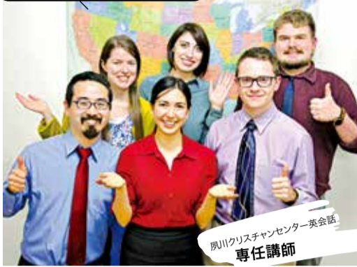
夙川クリスチャンセンター英会話 専任講師

ネイティブのアメリカ人専任講師から標準的できれいなアメリカ英語で様々な表現を学ぶ。フレンドリーで丁寧な指導が厚く支持されている。